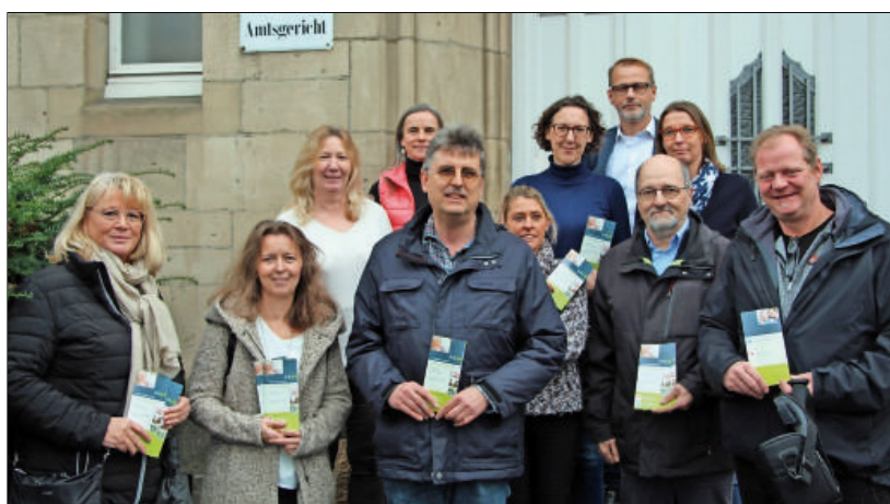
Vertreter der Betreuungsbehörde des Kreises Ahrweiler und der beiden Betreuungsvereine präsentieren gemeinsam das Programm für 2020.

Die Betreuungsvereine und die Betreuungsbehörde im Kreis Ahrweiler beraten und informieren das ganze Jahr hindurch umfassend zu allen Fragen rund um das Thema Betreu-